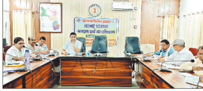
बैठक लेते अधिकारी।