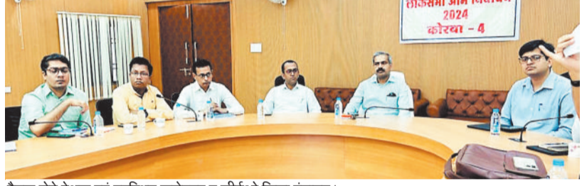
बैठक लेते प्रेक्षक एवं उपस्थित कलेक्टर व सीईओ जिला पंचायत।