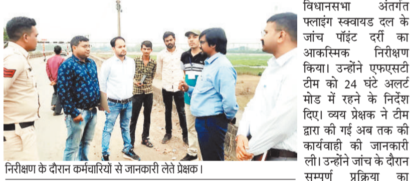
निरीक्षण के दौरान कर्मचारियों से जानकारी लेते प्रेक्षक।