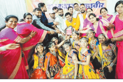
कार्यक्रम में शामिल लोग।