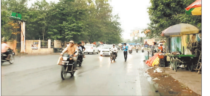
दोपहर बाद शाम को हुई बूदाबांदी से शहर भीगा।

तेज गर्मी के बीच मंगलवार को सुबह आसमान में बादल छाने और रुक-रुककर बारिश होने से दिन का तापमान 37 डिग्री सेल्सियस तक पहुंच गया। एक दिन पूर्व सोमवार को दिन का तापमान 44 डिग्री तक पहुंच गया था। मौसम के करवट बदलते ही तापमान 7 डिग्री सेल्सियस नीचे आने से लोगों को गर्मी से राहत मिली। दिनभर सड़कों में चहल-पहल की ही एक दिन पूर्व सूनसान रहा करती थी। तेज गर्मी के कारण जिले का तापमान बीते एक पखवाड़े से 40 डिग्री सेल्सियस के उपर चल रहा था। 42, 43 डिग्री सेल्सियस तापमान पहुंचने पर लोग सुबह